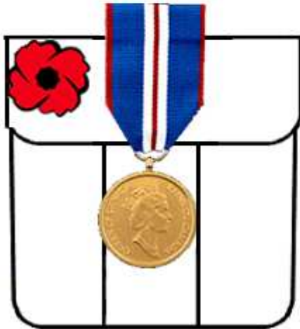
Cadet jacket with CHS Medal(s) Vareuse de cadet avec médaille(s) du RCDH