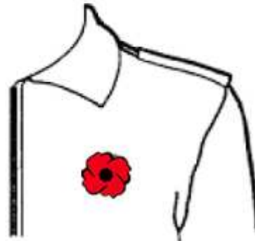
All-season jacket Manteau toutes-saisons

Wearing of the Poppy (left pocket) - Port du coquelicot (poche de gauche)